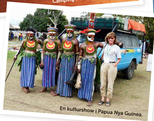
En kulturshow i Papua Nya Guinea.