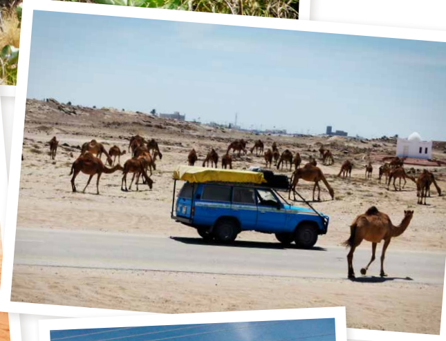
Olika transportmedel möts i Bin Ali tomb i Oman.